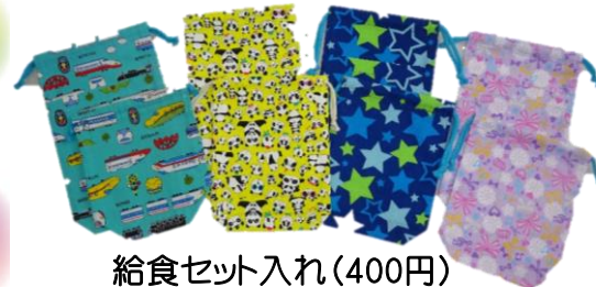
給食セット入れ(400円)