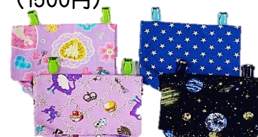
移動ポシェット(500円～900円)