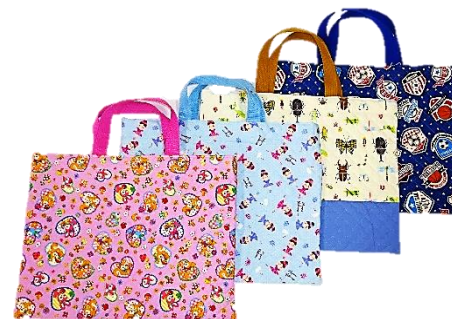
おけいこバッグ/読書バッグ(1500円)